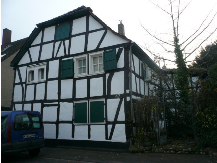
Abb. 2: Haus Weißer Hauptstr. 45 – 47 aus dem 18. Jahrhundert

Die Karte Bilgen von 1776 (Abb. 1) gibt den letzten bekannten Hinweis auf den Weinbau, der möglicherweise nach 1794 mit der Enteignung der Klöster und Stifte aufgegeben wurde.